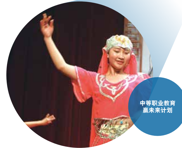
中等职业教育 赢未来计划

写到此处，包括笔者在内的许多人都不禁困惑：“慈善中心为何要花如此心力关注不同孩童群体的多元化教育需求？”答案其实很简单，因为他们坚信：“每个孩子都一样，都有接受平等教育的机会与权利。但愿，更多孩童们在面对未来时，能不再一条独木桥走到黑”。