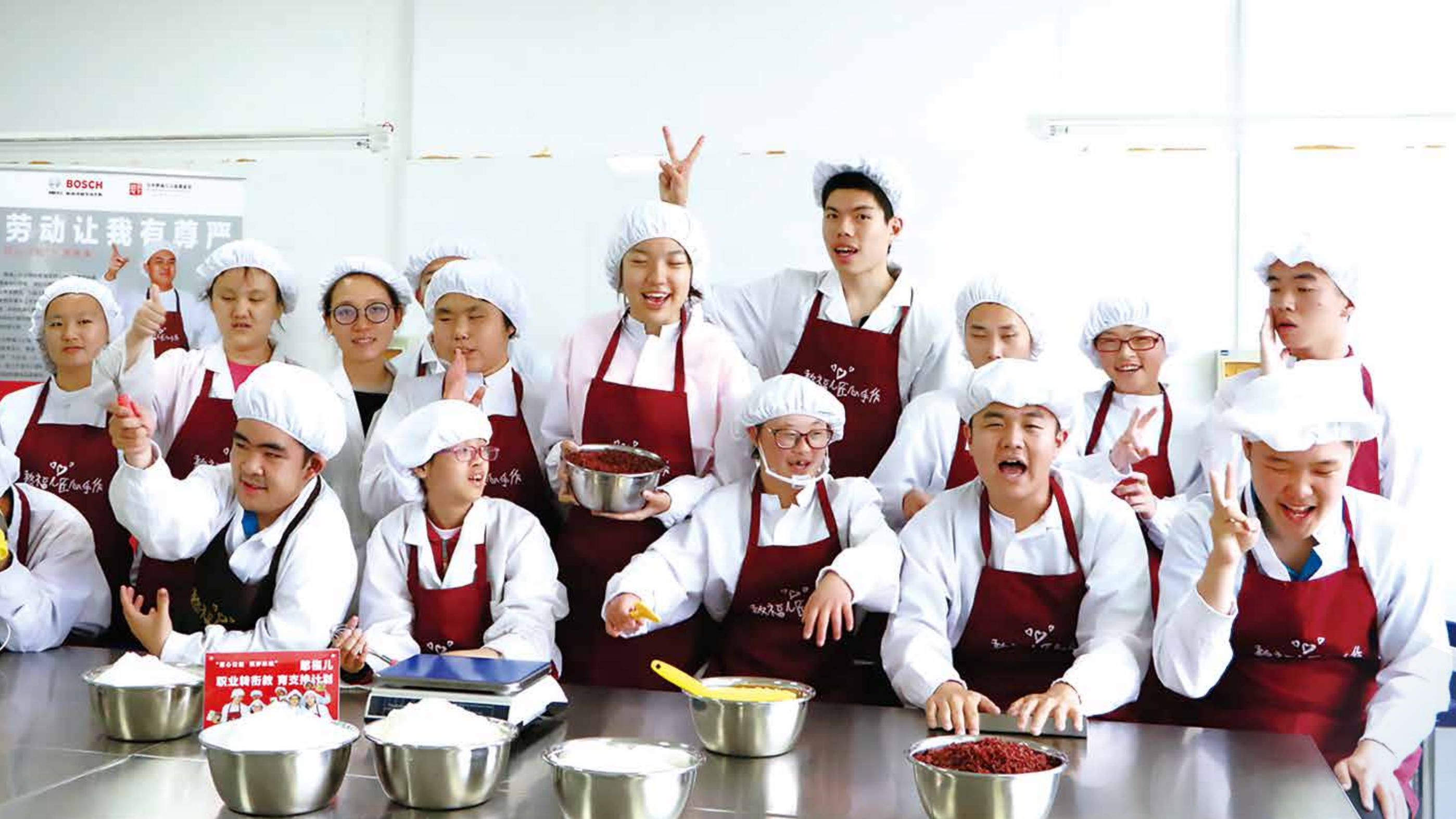
北京憨福儿职业转衔教育支持计划